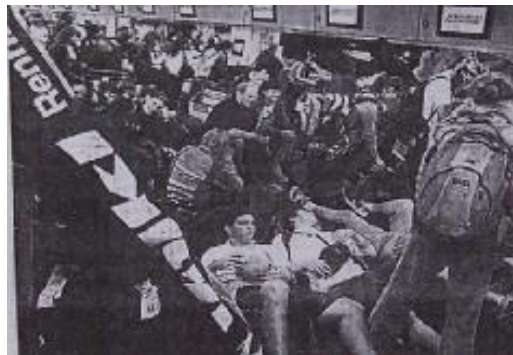
Figura 5. Epígrafe: « Varados: Los pasajeros improvisaron lugares de descanso entre el equipaje, en el hall de Aeroparque» ( Clarín , sección «La ciudad», 27 de julio de 2005, p. 34, el resaltado es original)

También en este caso, del mismo modo que en la representación del conflicto del Hospital Garrahan, en una columna ubicada a la izquierda de la página, denominada «Testimonios», el diario le dio espacio a las víctimas, es decir, a la palabra en primera persona de los usuarios afectados por la huelga, tendiendo nuevamente a «narrativizar» la protesta y apelar así la empatía con su lector.