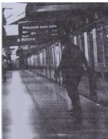
Figura 3. Epígrafe: «Andenes vacíos: el servicio se interrumpió por tercera vez en 20 días» ( Clarín , sección «La Ciudad», martes 7 de diciembre de 2004, p. 41)

Además de las imágenes que resaltaron el perjuicio al usuario, se incluyeron titulares, editoriales y «puntos de vista» que reforzaban este mismo sentido interpretativo.