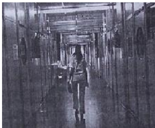
Figura 1. Epígrafe: «Hospital Desierto. Un pasillo del Garrahan ayer a la tarde en plena huelga de los trabajadores de ATE» ( Clarín , sección «La Ciudad», jueves 18 de agosto de 2005, p.42; el resaltado es original)