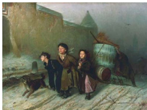
Figura 6. Vasily Grigorievich Perov, Troika. Apprentice Workmen Carrying Water , 1866 (oleo sobre tela, 123.5 x 167.5cm. The State Tretyakov Gallery, Moscú)

entre las voces contenidas en el texto, apelando a su actualización por parte de un lector modelo que debía involucrarse en la problemática.