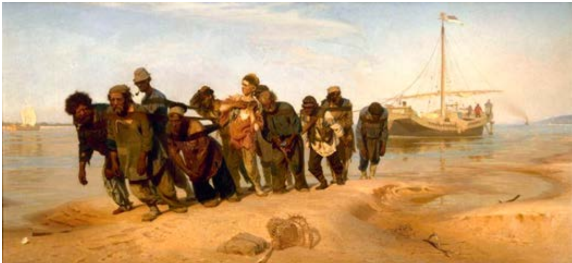
Figura 3. Ilya Efimovich Repin, Barge-haulers on the Volga , 1870-73 (oleo sobre tela, 131.5 x 281 cm cm. State Russian Museum, St. Petersburg)

of them shouts from the painting to the viewer: "look how unfortunate I am and how indebted you are to the People!" (...) You can't help but think you are indebted, truly indebted, to the people» (1876:212).