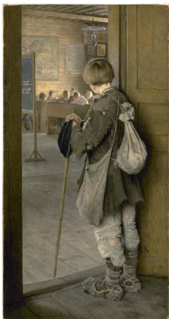
Figura 4 Nikolai Bogdanov-Belsky, At the School Door , 1897 (oleo sobre tela, The State Russian Museum, St. Petersburg)

de Ilya Efimovich Repin (figura 3) con toda una serie de recursos formales a fin de generar un vínculo intenso con el lector: la disposición de las figuras en una marcada diagonal que parecen salirse del cuadro y la conexión a partir de la mirada de uno de los personajes.