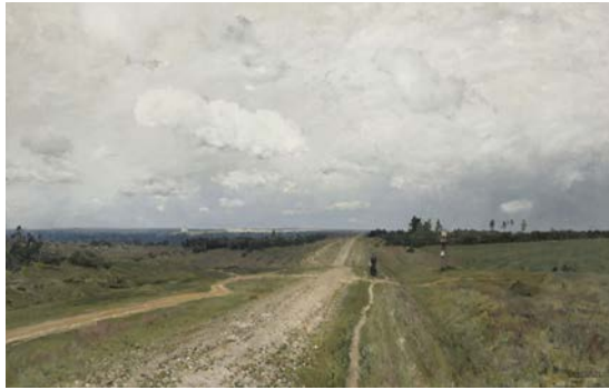
Figura 7. Isaak Ilich Levitán The Vladimirka Road , 1892 (oleo sobre tela, 79 x 123, The State Tretyacov Gallery, Moscú)