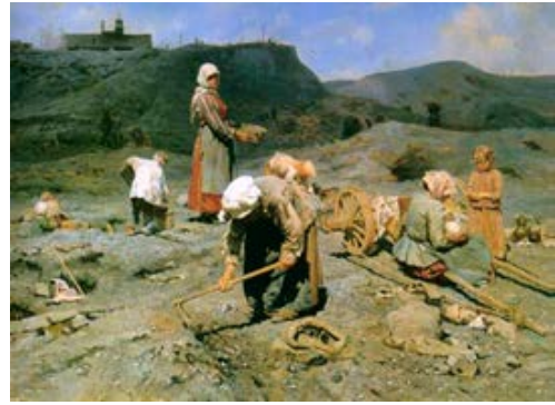
Figura 2. Nikolay Alexeyevich Kasatkin, Poor People Collecting Coal in an Abandoned Pit , 1894 (oleo sobre tela, 80.3 x 107 cm. State Russian Museum, St. Petersburg)