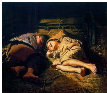
Figura 5. Vasily Grigorievich Perov, Sleeping Children , 1870 (oleo sobre tela, 53 x 61 cm. The State Tretyakov Gallery, Moscú)