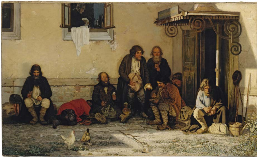
Figura 10. Grigory Grigorievich Myasoedov The Zemstvo Dines , 1872 (óleo sobre tela, 74 x 125 cm., The State Tretyakov Gallery, Moscú)

Por su parte, debemos destacar obras como Tea-party in Mytishchi near Moscow (1862) de Vasily Grigorievich Perov (figura 9) donde un burgués cómodamente sentado y atendido se dispone a tomar el té, es interrumpido por un mendigo y un niño pidiendo limosna, o The Zemstvo Dines (1872) de Grigory Grigorievich Myasoedov (figura 10) en la cual un grupo de campesinos comparte un pedazo de pan sentados en la calle, mientras que en la ventana aparece un sirviente que se dispone a lustrar la vajilla para la mesa de algún noble ruso. Ambas obras evidencian el contraste de la comida que los distintos actores sociales pueden permitirse.