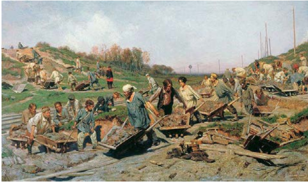
Figura 1. Konstantin Apolónovich Savitski, Repairing the Railway , 1874 (oleo sobre tela, 100 x 175 cm. The State Tretyakov Gallery, Moscú, Rusia)