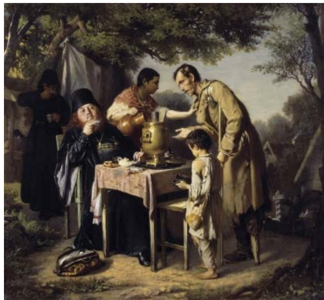
Figura 9 Vasily Grigorievich Perov, Tea-party in Mytishchi near Moscow , 1864 (oleo sobre tela, 43,5 x 47,3 cm., The State Tretyacov Gallery, Moscú)

sus rasgos físicos como psicológicos, evidencian una nueva preocupación artística que se distancia de la hegemonía del arte oficial representado por la Academia, a la vez que busca explicitar las contradicciones de la realidad contemporánea para impulsar la configuración de una conciencia social.